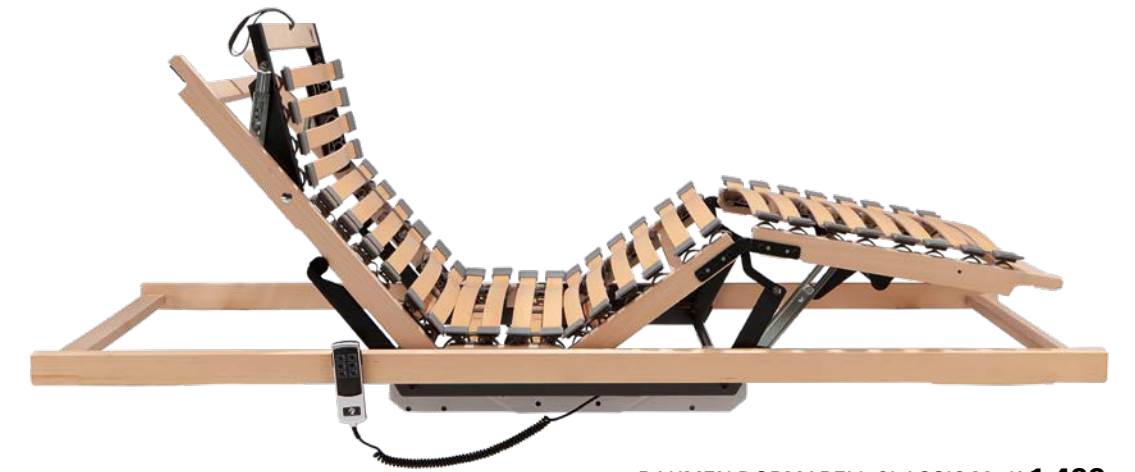
3. RAHMEN DORMABELL CLASSIC M2 K 1.499,-