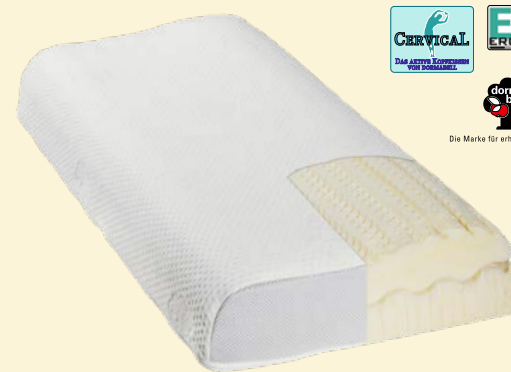
6. NACKENSTÜTZKISSEN DORMABELL CERVICAL PREISBEISPIEL: NB 4 149,95

UNSER KOMFORT-TIPP: DORMABELL CERVICAL – DAS ANGEMESSENE KOPFKISSEN, DAS DEN SENSIBLEN HALSWIRBELBEREICH AKTIV ENTLASTET.