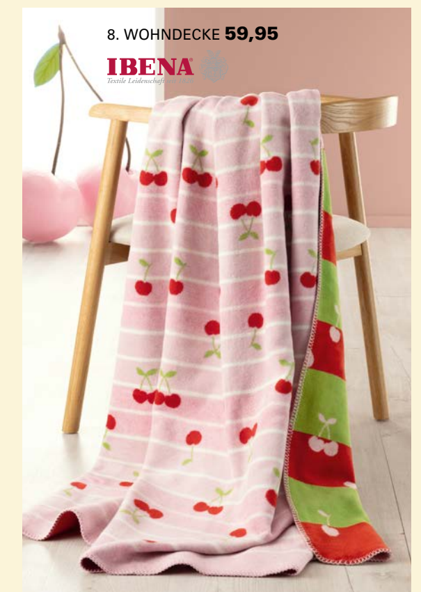
8. WOHNDECKE 59,95