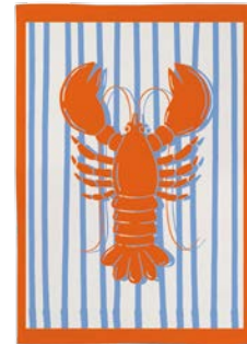
3. GESCHIRRTÜCHER je 7,95