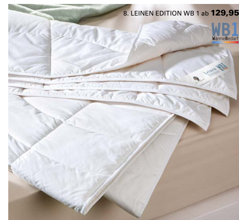
8. LEINEN EDITION WB 1 ab 129,95