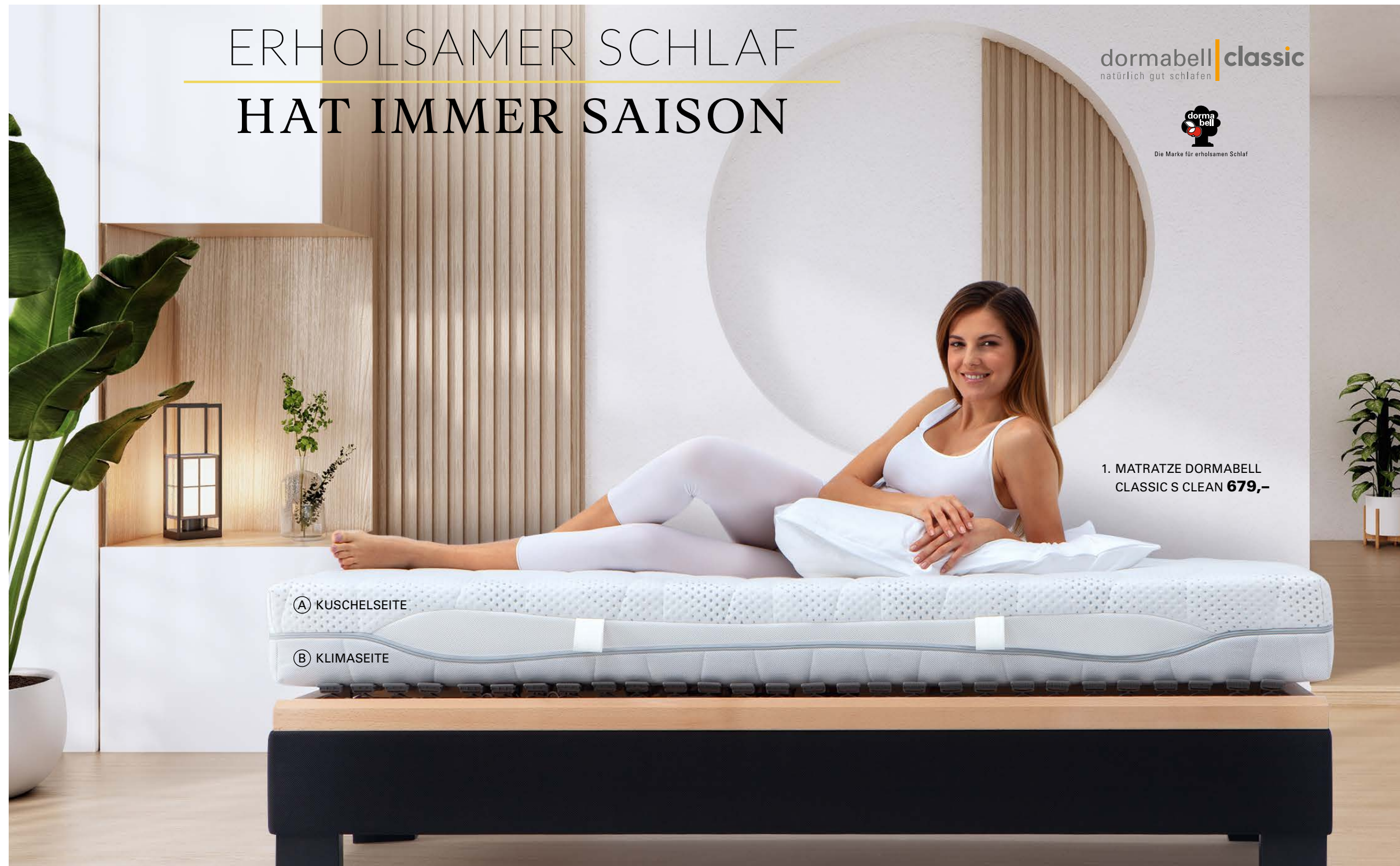
1. MATRATZE DORMABELL CLASSIC S CLEAN 679,-