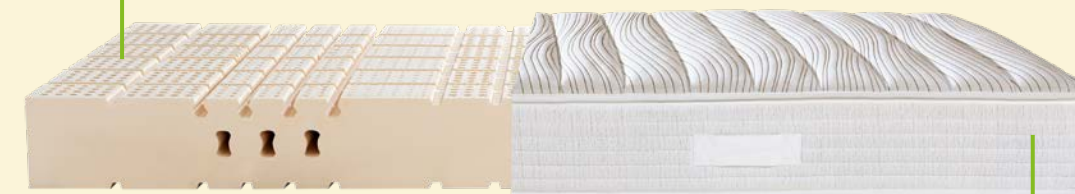
7. MATRATZE DORMABELL CLASSIC L WOOL 1.349,-

Der Matratzenkern aus 100 % FSC®-zertifiziertem Naturlatex passt sich optimal an den Körper an und verbessert die Schlafqualität spürbar.