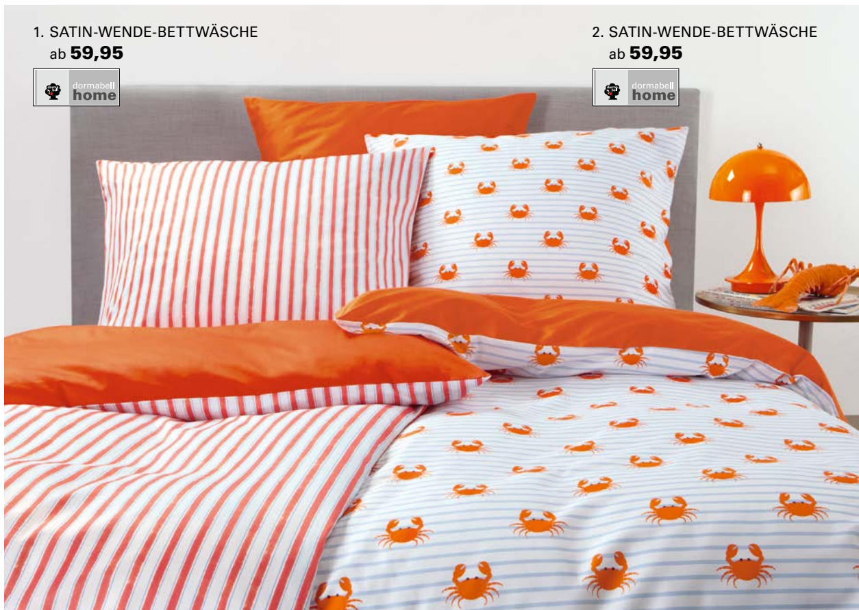
1. SATIN-WENDE-BETTWÄSCHE ab 59,95