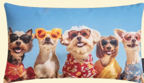
4. DEKOKISSEN 19,95

” UNSER TREND-TIPP: SONNIGE DESSINS FÜR TRAUMHAFTE MOMENTE. ”