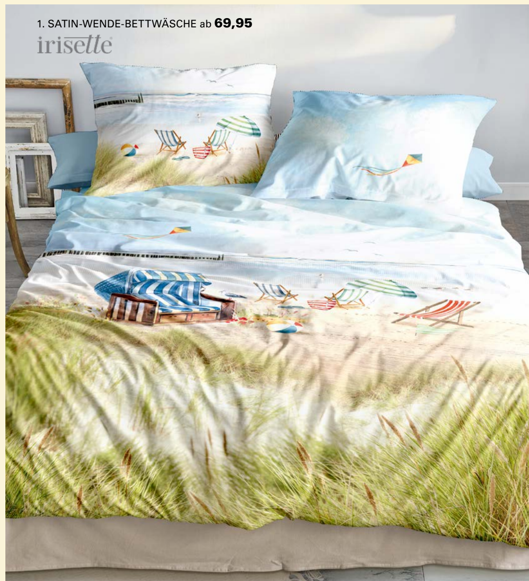
1. SATIN-WENDE-BETTWÄSCHE ab 69,95