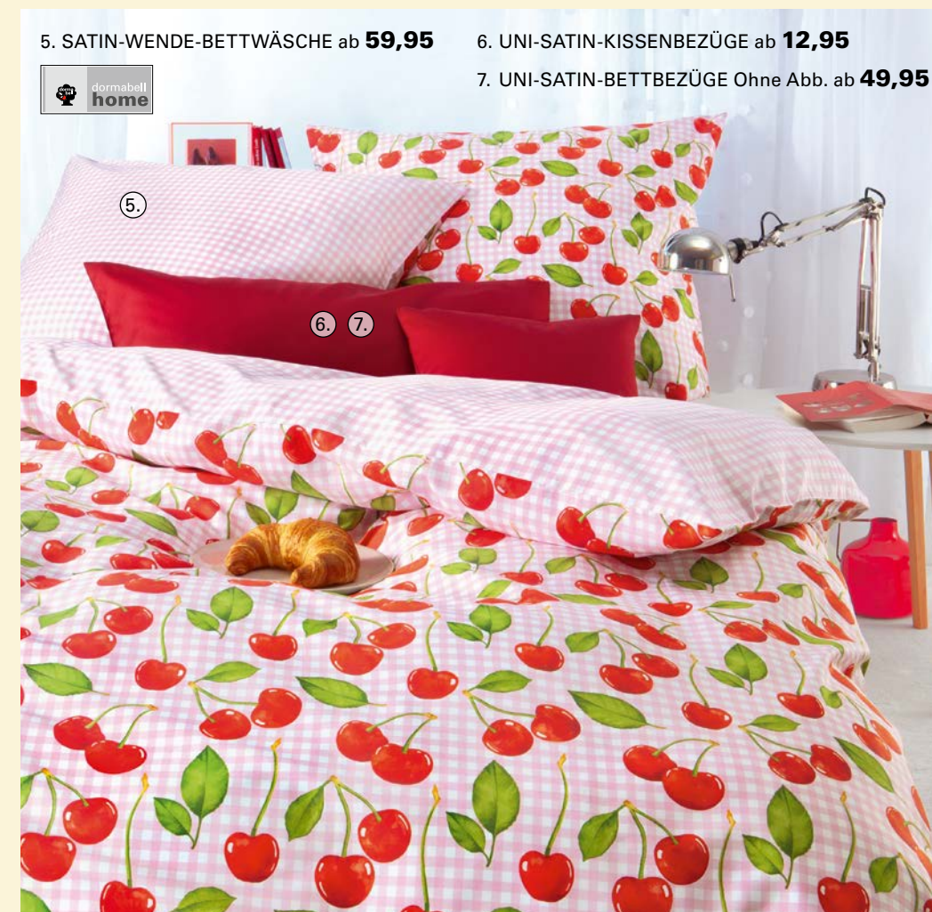
5. SATIN-WENDE-BETTWÄSCHE ab 59,95