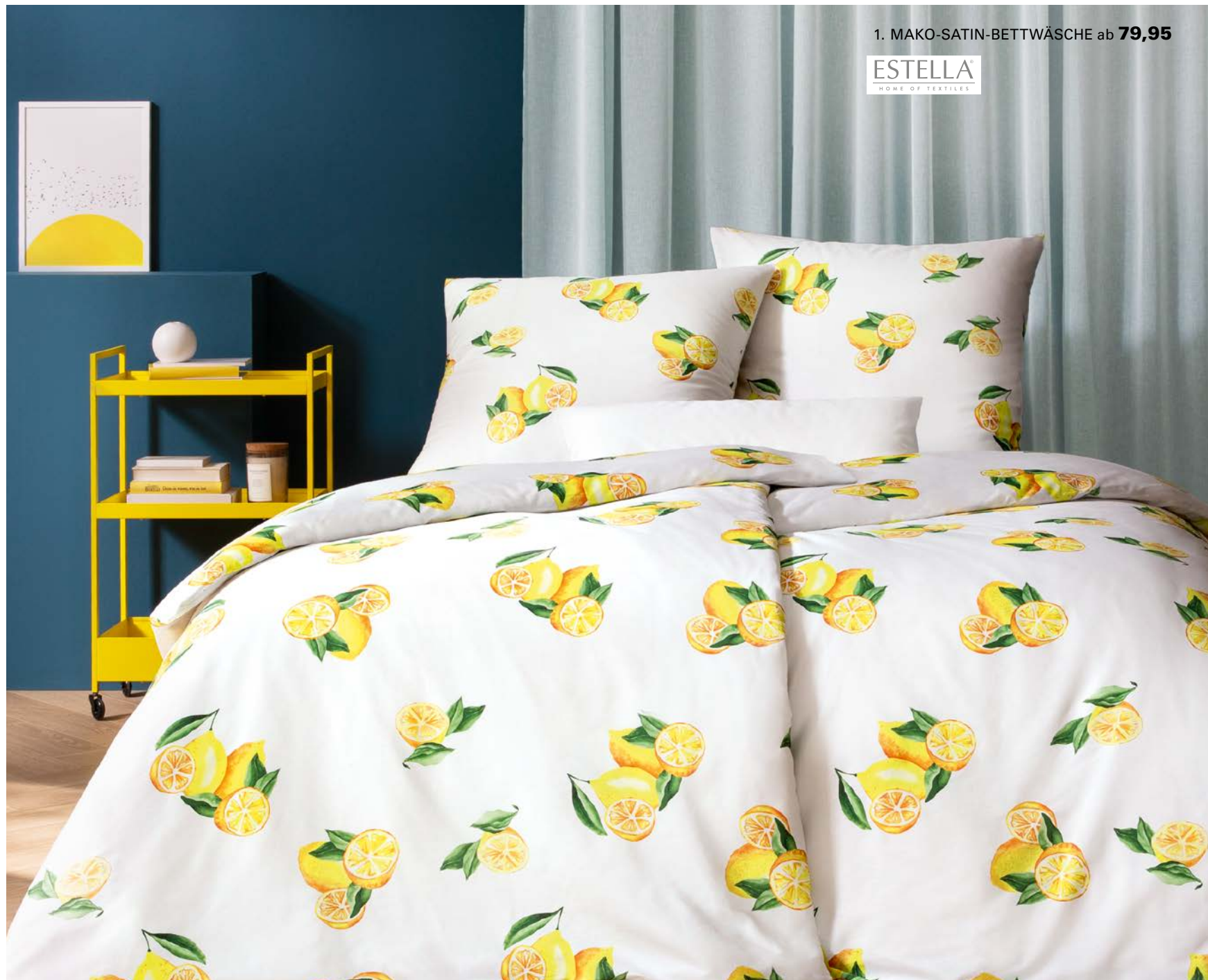
1. MAKO-SATIN-BETTWÄSCHE ab 79,95