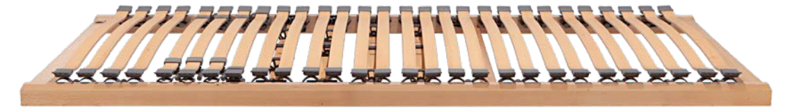
2. RAHMEN DORMABELL CLASSIC N 479,-